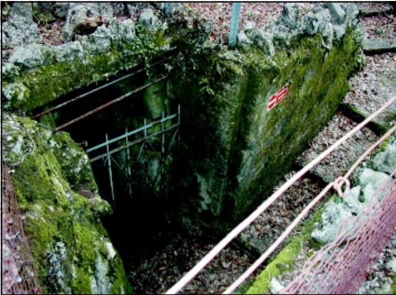
Grotta Clementina. Vhod.

Druge denominacije: Kaliè – Obèina: Trst – Zemljevid: CTR 5000, Villa Opicina, 110101 – Top. pozicija: Dolž. 13° 47' 31,5 – Šir. 45° 41' 29,2 – Metriène koordinate: Dolž. 2415878 – Šir. 5060391 – Višina vhoda: 302 m – Globina: 14 m – Razvoj: 95 m – 1.vhod: 0 m – 2.vhod: zamašen – Prva omemba: A. Beram, SAG, 4.1.1920 – Izpopolnitve: U. Mikolic, SAG, 6.1.1988 – F. Gherlizza, CAT, 2.3.2003 – Uporaba: skladišèe streliva (ni dostopna) – Bibliografija: Katastrski obrazec – Katalog.