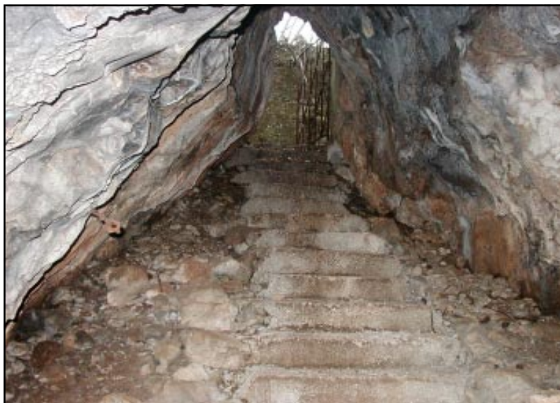
La scalinata d'accesso vista dall'interno della grotta.

svetovno vojno kot skladišče streliva avstro-ogrske vojske. Med drugo svetovno vojno jo je civilno prebivalstvo uporabljalo kot protiletalsko zatočišče. V tistem obdobju je bil tudi umetno postavljen nek drugi vhod z zaščitnimi cemetnimi zidovi, ki se je odpiral na spodnjo dolino. Pozneje je delno zasipanje doline zamašilo vhod.