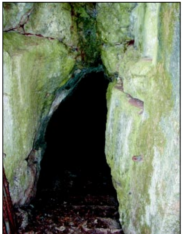
L'inizio della scalinata d'accesso.

Pravijo, da so med drugo svetovno vojno preko njega bežali pred nemško ofenzivo.