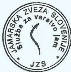
Jure Tičar vodja Službe za varstvo jam pri JZS

V obdobju do izvedbe Občnega zbora JZS v letu 2015 je bila SVJ vključena v intenzivno urejanje nove spletne strani, skupaj s pregledom in določitvijo gradiva. Obenem je bil uveden nov poenoten e-mail naslov SVJ in sicer varstvo.jam@jamarska-zveza.si . S strani zainteresirane javnosti je SVJ prejela vprašanja o odgovornosti lastnikov zemljišč na katerih se nahajajo jame ter čiščenju vodnjaka na katere se je odzvala s predlogi in pojasnili, podprtimi v veljavni zakonodaji na omenjenih področjih.